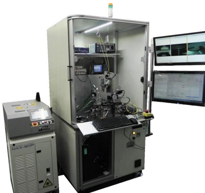
高精度光部品 YAG 実装溶接機 外観写真